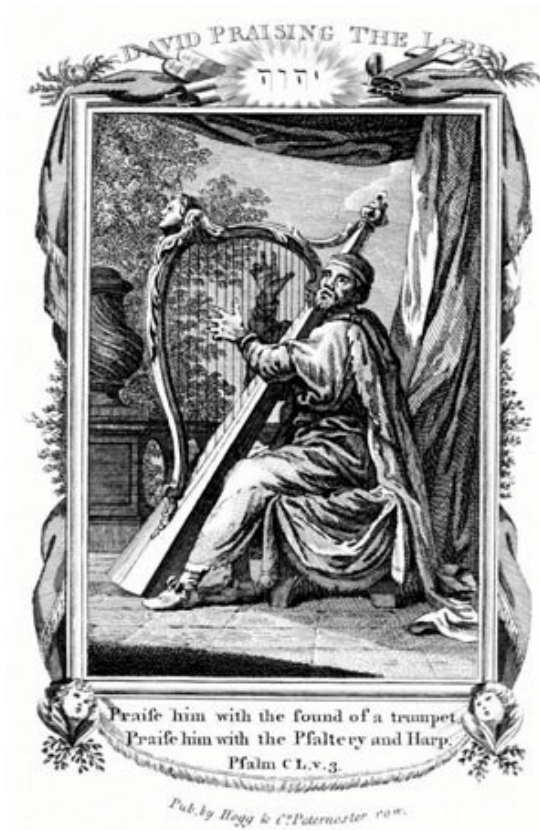
Il·lustració: Rei David cantant psalms bíblics.

Destaquen, pel seu nombre, cromatisme i complexitat vocal, els responsoris i les lamentacions. Tanmateix: el llenguatge harmònic, el teixit del fraseig i el dramatisme vocal de tot el conjunt de la producció religiosa ens confirma, tal com hem assenyalat en els villancets-cantates, l'adhesió de Juncà al programa del classicisme d'influència mozartiana..