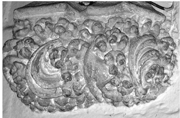
6.- Tomàs Barça, mènsula (cap a 1526), detall de l'interior de l'església de Sant Iscle i Santa Victòria, Dosrius.

Les diferències obvies en el color més ocre i la consistència més tova de la pedra utilitzada a la portalada i les tres mènsules del cor (foto 7), si la comparem amb la pedra de Barcelona, més resistent i d'un gris molt accentuat de la resta de l'edifici, i el fet que l'ornamentació sigui més florejada i diversa, ens feu valorar la hipòtesi que la portalada i les mènsules poguessin haver estat fetes per un escultor forani, aliè a l'equip que va contractar les obres de l'edifici. La proximitat estilística de la portalada palamosina amb el rentador de mans del convent de Bellpuig, on trobem recursos ornamentals