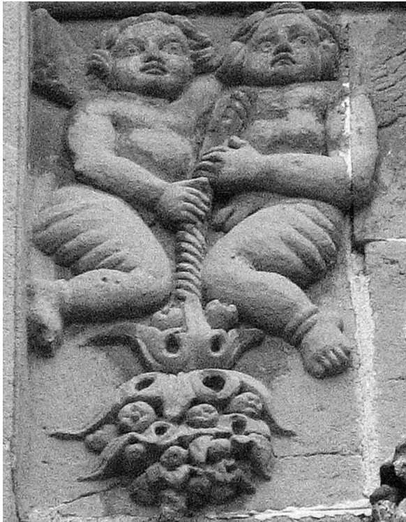
5.- Parella d'àngels subjectant una soga amb poms de flors, detall de la portalada de llevant.

finalització de les dues últimes capelles laterals, la de Sant Jaume i Santa Elisabeth, es situa a l'any 1539. No hi ha cap menció al vestíbul, a la porta de llevant o al campanar. Trijueque apunta que tant el cor com el vestíbul ja estaven acabats cap el 1540. (7) Durant l'atac turc de 1543 es va cremar tota l'església, fet que va endarrerir més l'acabament de les obres, però desconeixem si la portalada ja estava finalitzada.