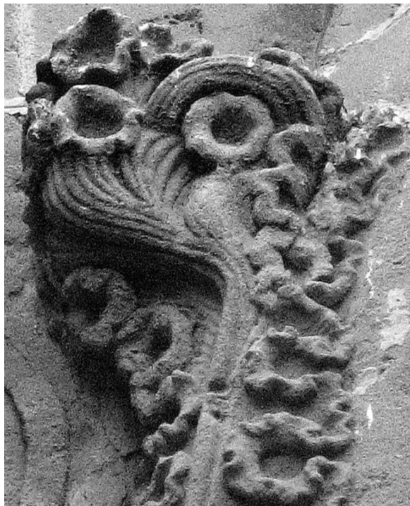
8.- Decoració del gablet, detall de la portada de llevant.

Pere Reig fou el mestre i director de les obres. En la portalada encara son molt visibles les traces d'aquesta restauració, maldestre i escadussera, que es duigué a terme a principis del segle XX. L'any 1936 les escultures mencionades quedaren mutilades, les dues perderen el cap davant l'acció devastadora de les forces d'esquerra que assumiren el control total de la vila, i com en molts altres llocs de Catalunya, confiscaren l'església parroquial i cremaren a la platja tot el que pogueren arrebregar del seu interior. Les figures presentaren un aspecte decapitat fins el 1959 en que l'escultor local Enric Pagès López realitza una nova reforma de la portalada restituint uns nous caps al seu lloc. (14) Aquests es varen realitzar a partir de fotografies antigues, el que significa que la seva aparença actual no devia ser gaire diferent de l'original.