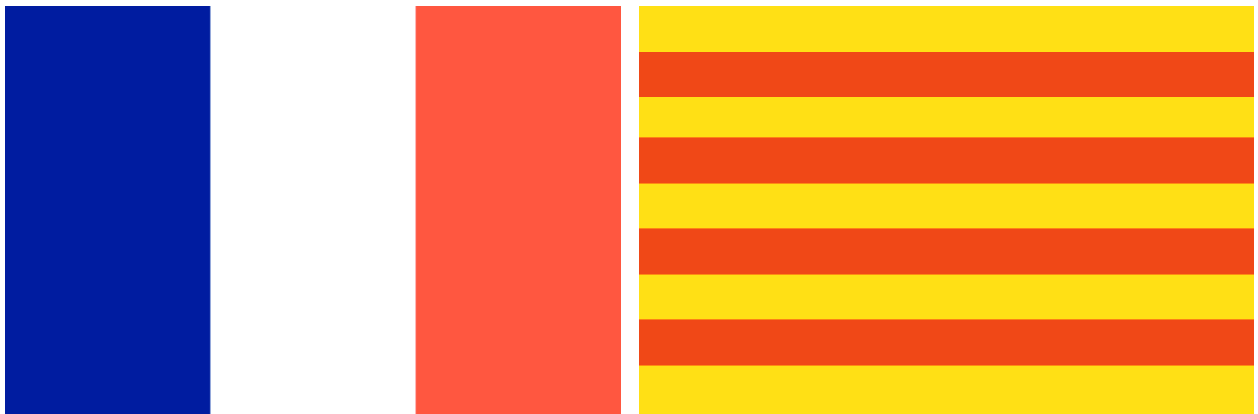
La bandera tricolor revolucionària, amb el blau de la llibertat, el blanc de la igualtat i el vermell de la fraternitat, i que esdevindria símbol de la nació francesa, onejaria juntament amb la catalana al Principat en temps de l'Imperi Napoleònic

Llàstima que Napoleó no continuàs la "reunió" al seu imperi amb la resta de l'antiga Nació Catalana, almenys que sapiguem. Com a mínim els menorquins durant el segle XIX hauríem tardat uns anys més a tornar a caure en poder de la Gran Castella.