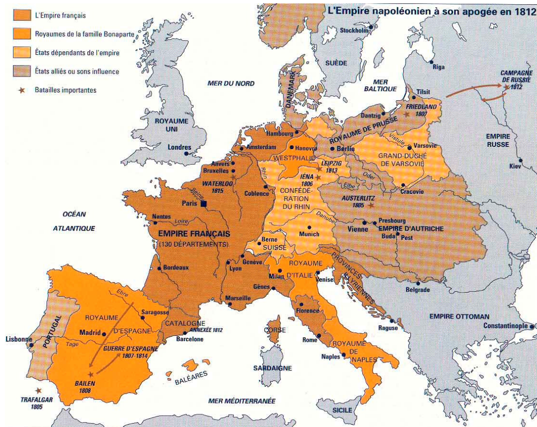
L'Imperi de Napoleó Bonapart, amb el Principat de Catalunya i Còrsega directament "reunits" sota el seu poder