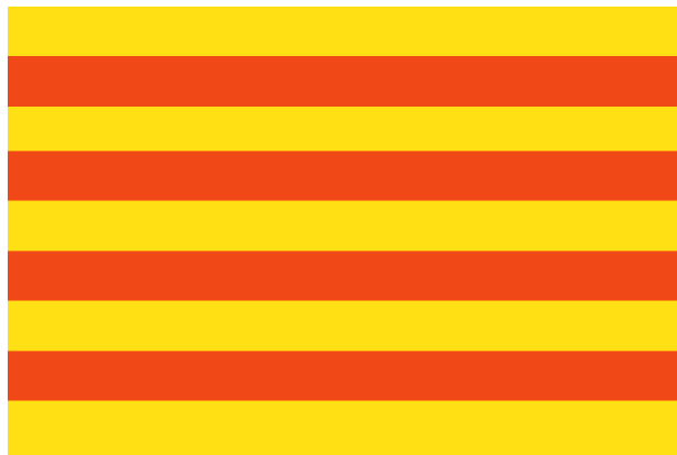
Les banderes nacionals de Còrsega i dels Països Catalans