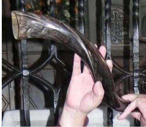
La Banya d'Otger Cataló presentada a Montgrony

La “banya” és un element important en el relat de la Bíblia, i la cultura europea, la incorpora en les seves llegendes mitològiques. La trobem present, a “ La Cançó de Rotllà” - ubicada també en els Pirineus, igual que la d'Otger Cataló – , en “El Senyor dels Anells” , a la tradició cultural d'Euskal Herria i a la tradició d'Israel.