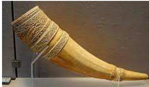
La Banya de Rotllà. Museu del Louvre ( París)

La “banya” és un element important en el relat de la Bíblia, i la cultura europea, la incorpora en les seves llegendes mitològiques. La trobem present, a “ La Cançó de Rotllà” - ubicada també en els Pirineus, igual que la d'Otger Cataló – , en “El Senyor dels Anells” , a la tradició cultural d'Euskal Herria i a la tradició d'Israel.