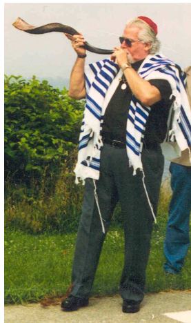
Un rabí jueu fent sonar el shofar o banya

Aquesta banya, presentada a Montgrony, per a recuperar un element simbòlic de la llegenda que s'hi ubica, la denominem "Banya d'Otger Cataló", ha estat portada directament des d'Israel, on se la coneix amb el nom de shofar o xofar .