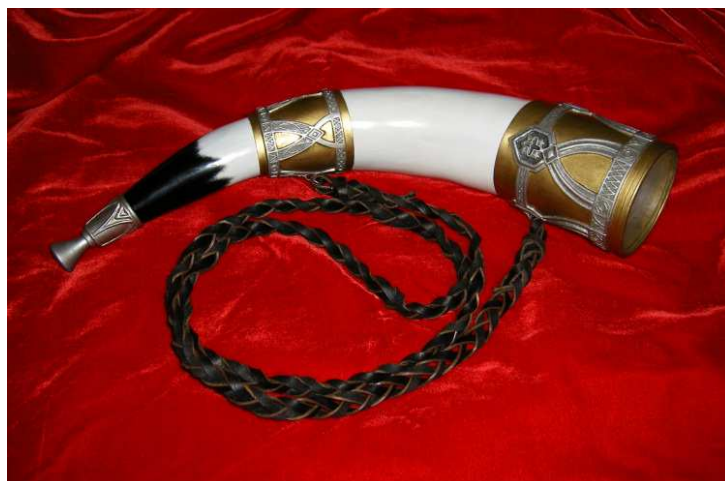
La Banya de Gondor. El Senyor dels Anells