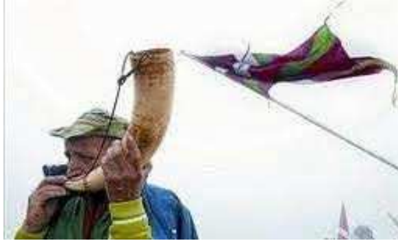
Un basc fa sonar la banya al Mont Gorbeia. Euskal Herria

Aquesta banya, presentada a Montgrony, per a recuperar un element simbòlic de la llegenda que s'hi ubica, la denominem "Banya d'Otger Cataló", ha estat portada directament des d'Israel, on se la coneix amb el nom de shofar o xofar .