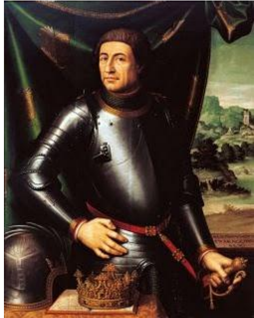
Imatge d'Alfons el Magnànim.

Avui per tant, ens endinsarem al Castell de St . Miquel ( molí de Pals ) i us parlaré de les famílies Pere, Tafurer, Tamarit i Villalonga, totes elles relacionades del dit castell. Foren els propietaris del molí Gros de Pals i castell de Sant Miquel durant 5 segles.