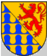
Escut dels Vilallonga.

Casat amb Anna de Xammar i copons tingué un fill que es digué Salvador de Tamarit que anà a les corts de 1705 i una filla que fou la pubilla casada amb el noble Gaietà de Villalonga, també com a síndic fou representant a les corts de 1701 i 1705. Els molins passaren a anomenar-se de Villalonga.