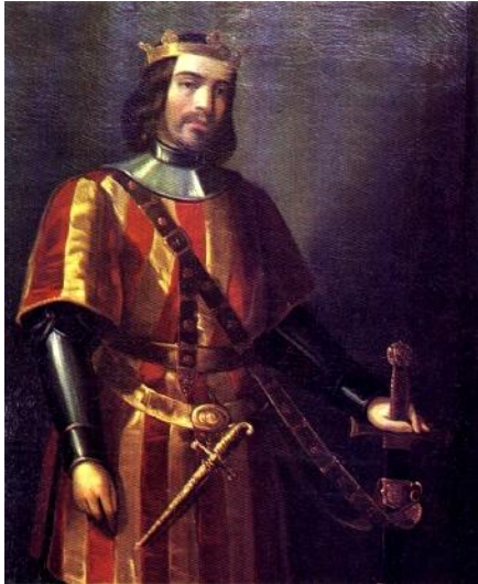
Joan II rei d'Aragó i comte de Barcelona

Patrimoni atorga permís a Juan de Rejada per recollir les aigües de la riera vella i dels estanys per fer-lo funcionar. Poc temps abans, el 6 de setembre de 1321, els síndics de Pals es comprometen a pagar al rei 500 sous anuals per fer enderrocar un molí que ja tenia, juntament amb els terraplens i rescloses per ser ells els causants de les grans inundacions que en temps de pluges en quedar l'aigua retinguda i també per poder eixugar els estanys