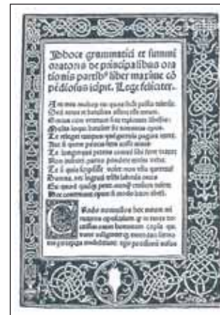
Página de Phoco Grammaticae et Summi oratis . Pere Posa. Barcelona, 1488.