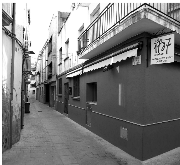
El carrer de la Bateria, popularment era conegut amb el nom del "carrer de les Bruixes".