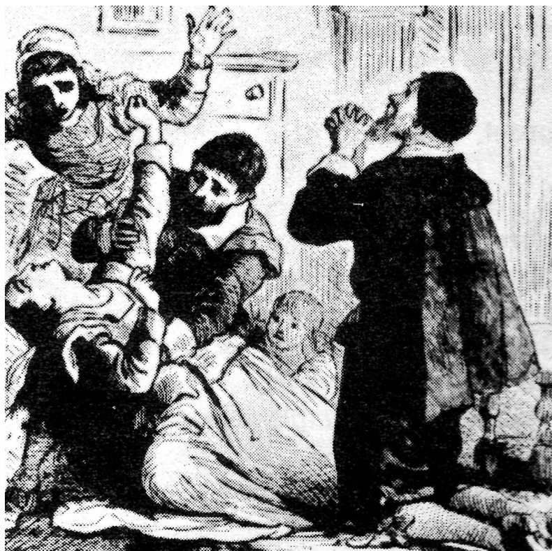
La mort sobtada d'una dona aixecava suspicàcies i temors entre els més supersticiosos.

Hi havia una malfiança endèmica contra les dones. Aixecaven tot tipus de suspicàcies i sospites, sobretot quan es relacionaven amb algun fet prodigiós o una mort sobtada. En aquests casos, el rector i el metge, tenien assignada una funció fins a cert punt tutelar, es convertiren sovint en l'antídote perfecte per posar una