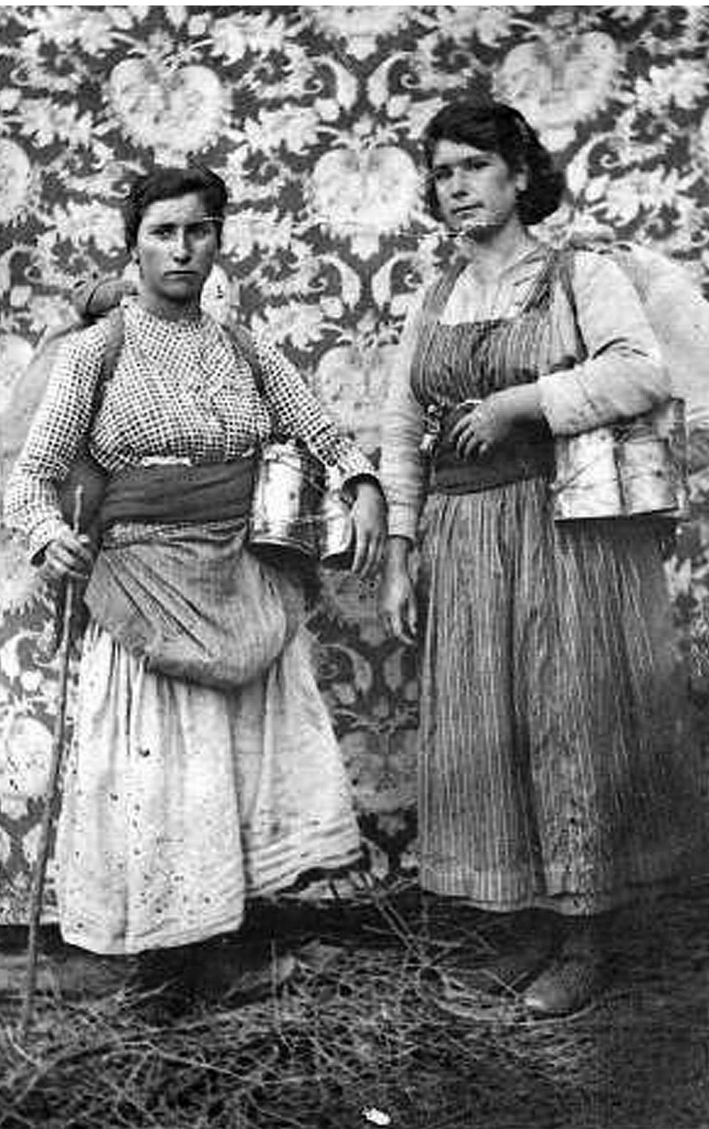
Dues trementinaires en una fotografia de principis del segle XX.

conserva una d'aquestes invocacions; un conjur amb tota regla. El model és del primer quart del segle XVIII 24 . El document, escrit completament en llatí, porta el títol de " Benedictio contra mures, locustas, bruchos et vermes noxios " ("Benedicció contra rates, llagostes, insectes i cucs nocius"). El text el recitava el capellà davant dels camps de conreu o des d'un comunidor, amb tota la gent expectant al seu voltant. S'iniciava amb un salm, continuava amb diverses oracions i finalitzava amb una benedicció. L'oració anava acompanyada de l'aspersió d'aigua beneïda al lloc afectat per la plaga.