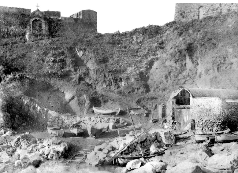
La font Trobada era a sota Pedró, al costat de la barraca del primer terme.

Si baixem del Pedró pel carrer Molins i tombem pel de la Roda, arribem a un carreró petit quasi paral·lel al carrer Major que rep el nom de carrer de la Bateria. El seu traçat irregular es deu al caminet que resseguia el baluard que hi havia en aquest lloc. A pesar del nom actual, hi ha gent que encara el recorda com el "carrer de les Bruixes". L'explicació d'aquest motiu no l'hem de buscar en cultes ancestrals si no en temps menys reculats. Fins poc després de la Guerra Civil els carrers de Palamós havien estat escassament enllumenats (per no dir gens), i sembla ser que el carrer de la Bateria era el pitjor de tots; feia una