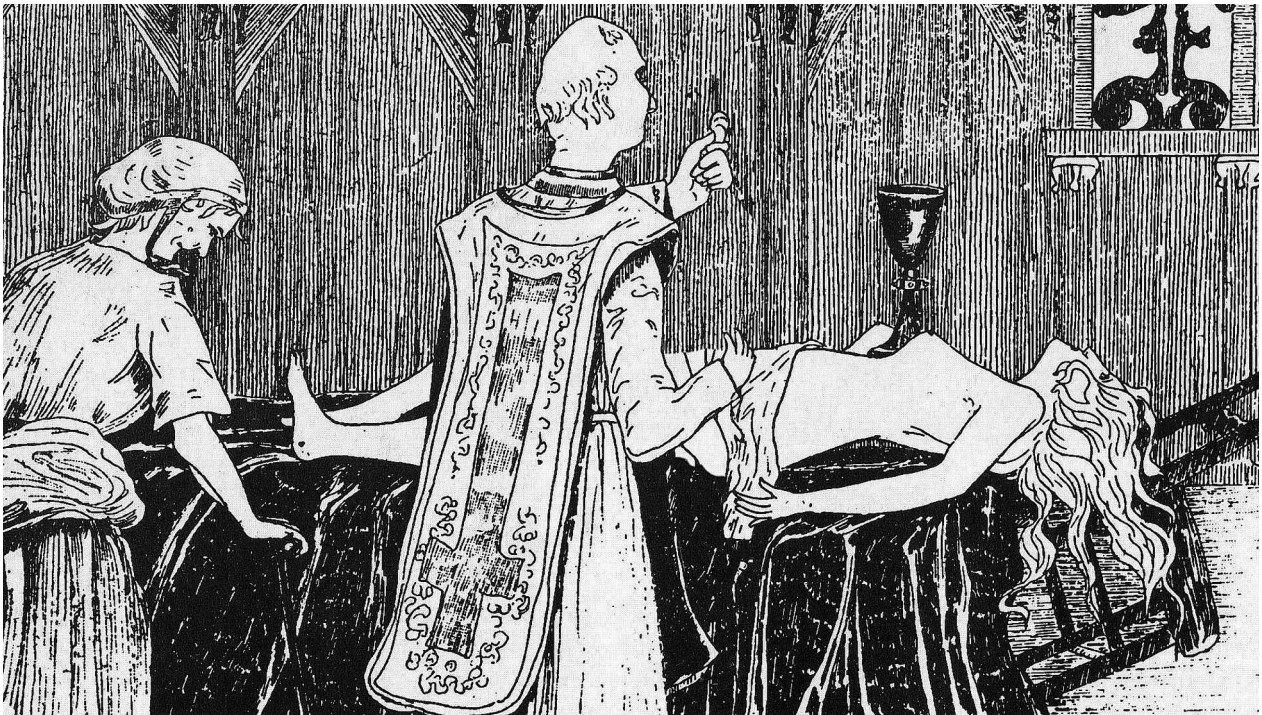
Algunes vegades, n'hi havia prou en trobar estranyes marques corporals al cos d'una difunta per considerar-la bruixa.

basarda especial 5 . Tant era així que els nens d'aquella època es desafiaven a passar per aquell carrer de nit. El minyó que l'aconseguia transitar de punta a punta tot sol, venent l'obscuritat i els seus propis fantasmes, ja podia anar a dormir pensant que era un milhomes 6 .