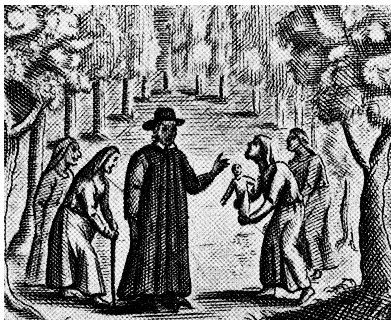
Els capellans reunien en la seva persona cert poder màgic i es convertien en antídots contra la bruixeria. Gravat del segle XVII.

mica de seny enfront les supersticions. Exposaré alguns casos que apareixen registrats al llibre d'òbits de Santa Maria de Palamós i que ajuden a entendre millor l'ambient supersticiós de l'època, el temor i el respecte que sempre generava la mort, sobretot quan s'esdevenia en dones en estranyes circumstàncies.