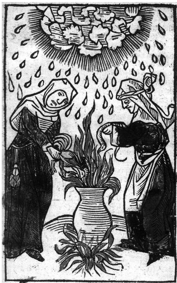
Bruixes preparant un encanteri per causar tempestes i pedregades. Gravat del segle XV.

Com ja vaig apuntar en un anterior article 1 hi ha indicis que les pedres del Gegant de sa Punta, per les seves