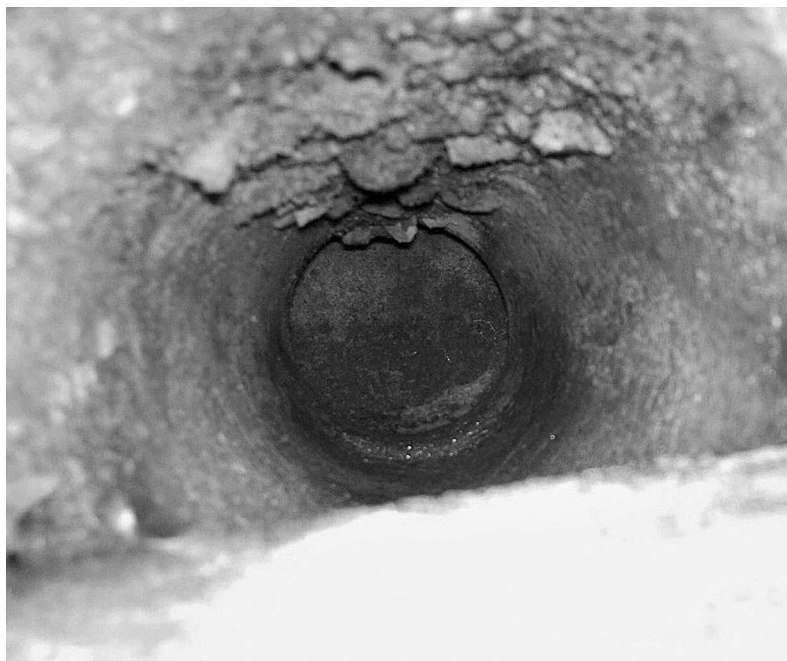
Antic pou d'una casa del carrer Tauler i Servià, que va aparèixer durant la remodelació de la finca.

Aquest personatge tenia un carro i traginava sovint blat i queviures entre Palamós i Sant Joan, fent i desfent el vell camí que des de la plaça dels Arbres, anava pel carrer Sant Joan Baptista de la Salle, es bifurcava a l'ac-