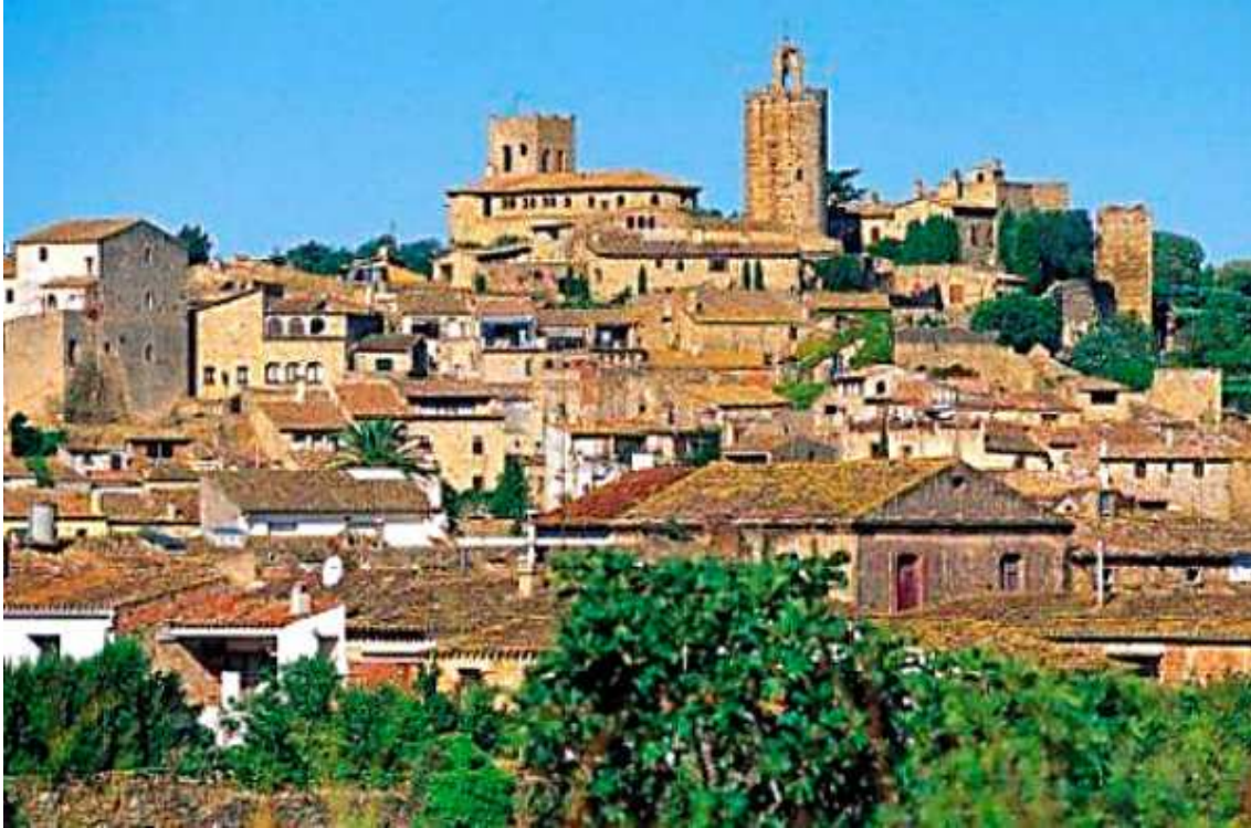
Una imagen de archivo de Pals