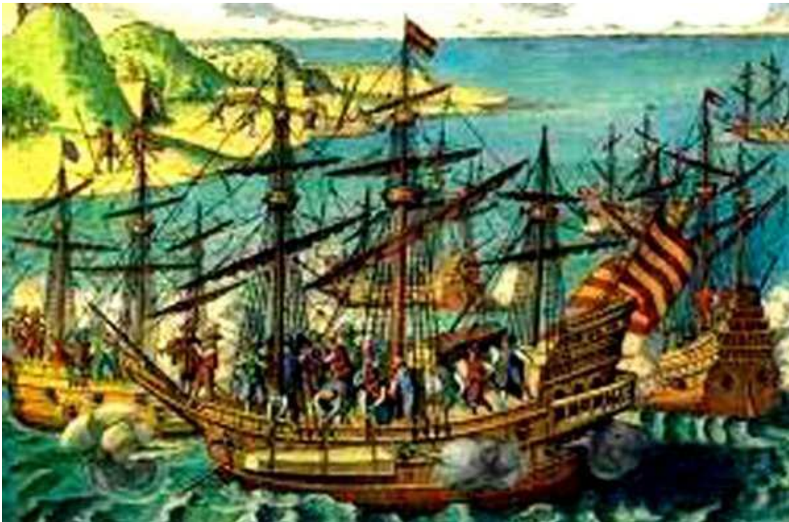
Una pintura de la época con carabelas que ondean la bandera catalana