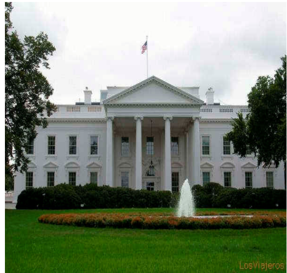
Les 4 columnes de capitells jònics a la Casa Blanca (EEUU)