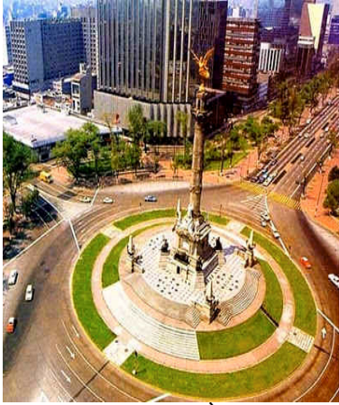
Monument Columna de l'Àngel de la Victòria (Mèxic D.F.)