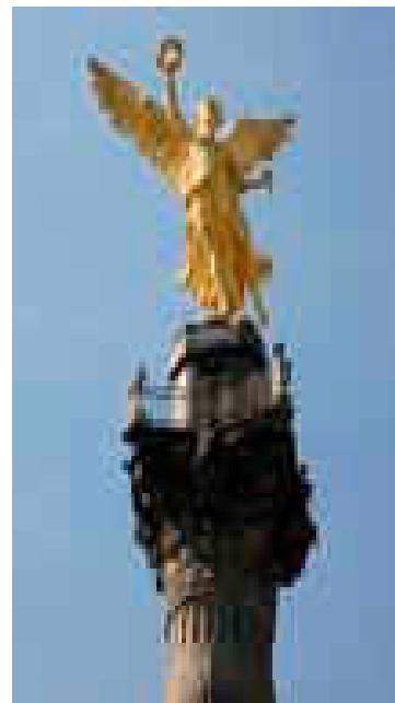
Monument Columna de l'Àngel de la Victòria (Mèxic D.F.)