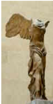
La Victòria de Samotràcia

Això vol dir, també, entre d'altres coses, construir símbols que creïn una genuïna consciència nacional.