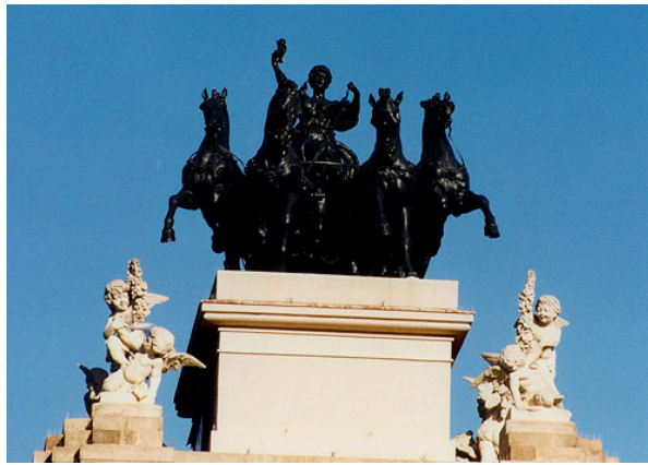
Quàdriga situada damunt de la Font de Venus del Parc de la Ciutadella de Barcelona (Catalunya)