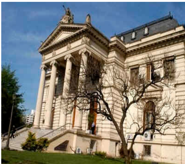
Les 4 columnes de capitells jònics a la Casa de la Legislatura. Ciudad de la Plata (Argentina)