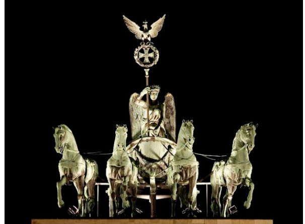
Quàdriga que està damunt la Porta de Brandenburg a Berlin (Alemanya)