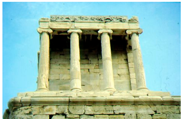
Temple de la deessa Atenea Niké (Grècia). Atenea és la Minerva dels romans. "Niké" vol dir "Victòria".