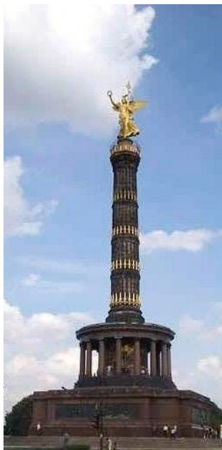
Monument Columna de la Victòria. Monument de Berlín (Alemanya)

Aquests elements "simbòlics" els troben a d'altres llocs del món: