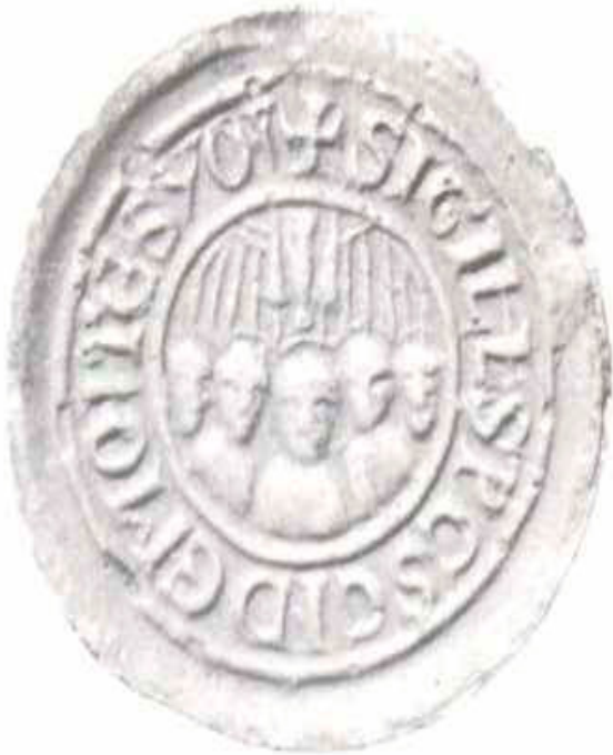
Segell Abadia de Nostra Senyora de Sió. El colom que es veu a dalt representa a l'Esperit sant.

Cristòfor Colom volia fer una Croada. La recuperació del Sant Sepulcre de Jerusalem fou un objectiu nacional català: La Corona d'Aragó, Jaume I, Ramon Llull i Cristòfor Colom.